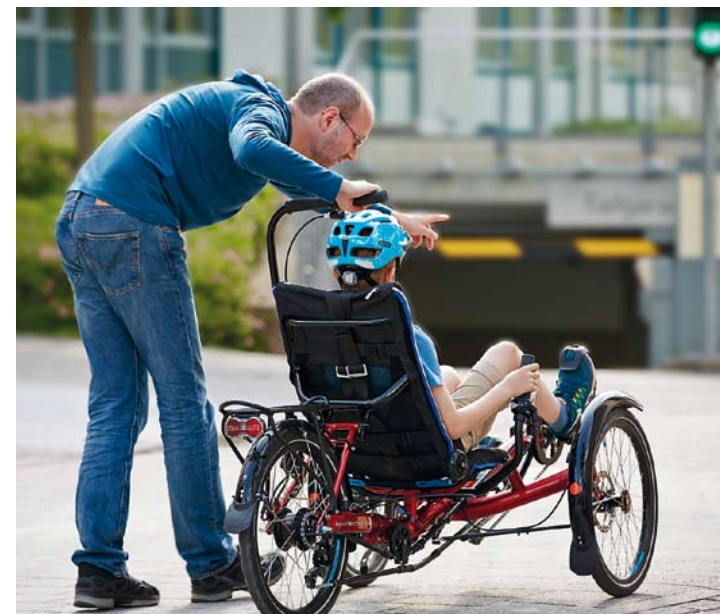
Die nebeneinander angeordnete Position unterstützt eine gleichberechtigte Kommunikation zwischen Nutzer und Begleiter.