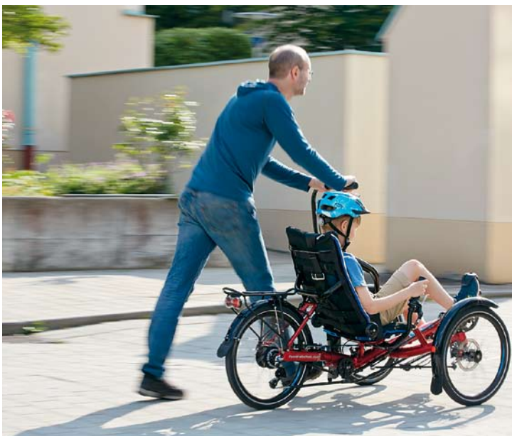
Der Begleitergriff am Gekko fxs ermöglicht aktives Erleben von Mobilität und Umwelt für Kind und Betreuungsperson.