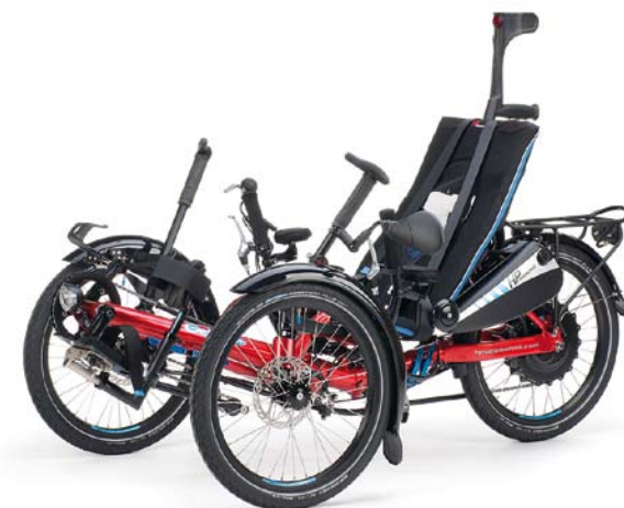
Beispiel für ein vollausgestattetes Gekko fxs mit E-Antrieb und montierten Reha-Optionen.