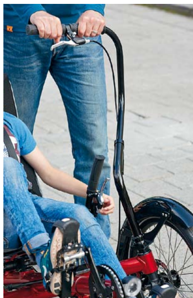
Der stabile Begleitergriff ermöglicht Mitlenken, Beschleunigen und auch aktives Bremsen.